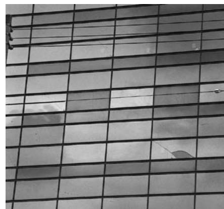
▲ ビル外壁破壊、ガラスは2枚のみ破損 (弾性シーリング材)