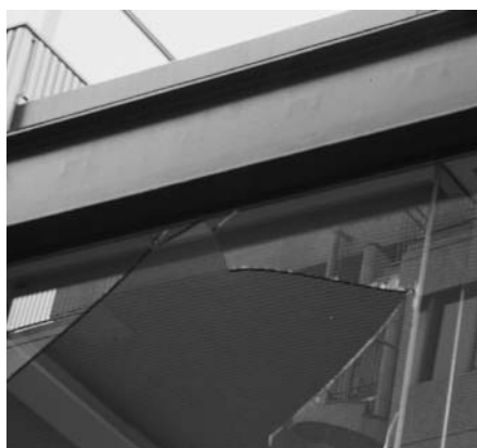
▲ フレームとガラスが接触、ガラスは落下