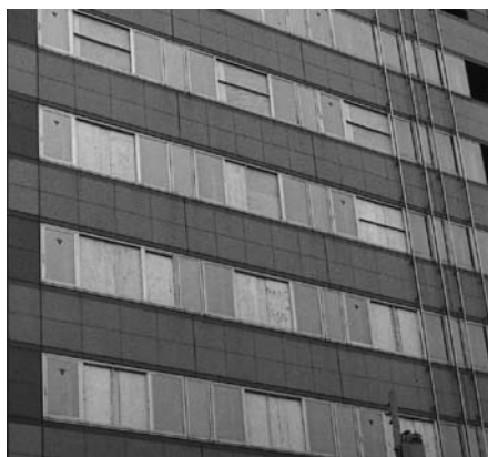
▲ サッシのFix部のみガラス破損