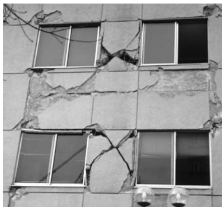
▲ ガラスが拘束を受けなかった。躯体のみ破壊。