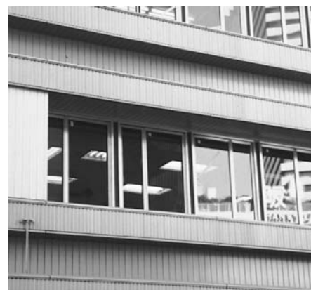
▲ スチールサッシにパテ施工、ガラス破損