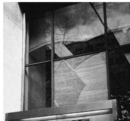
▲ スチールサッシにパテ施工、ガラス破損